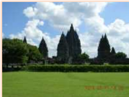
ボロブドール寺院の直ぐ近くにある ヒンズー教寺院「プランバナン」 9~10世紀に立てられた世界遺産