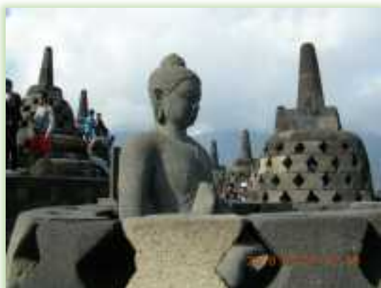
1991年上皇ご夫妻もここに来られた