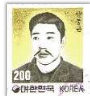
安重根は韓国の切手になった